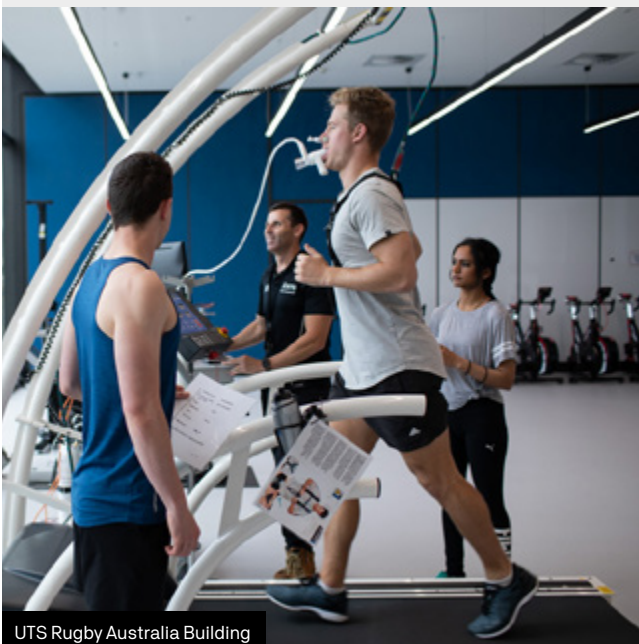
UTS Rugby Australia Building