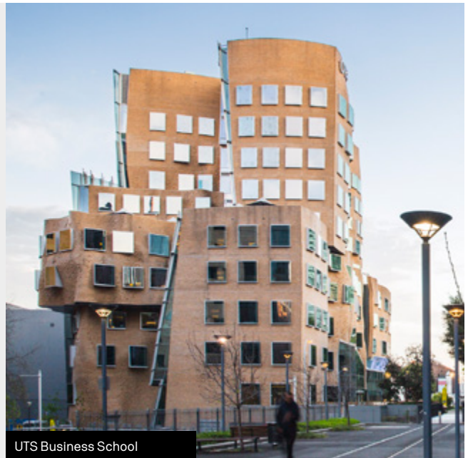
UTS Business School

毗邻悉尼中国城的这一历史街区正在迅速转型成为创新与创业活动中心。该地区以Frank Gehry设计的悉尼科技大学商学院而闻名，朝气蓬勃的学习氛围、研究与合作是这里的特色。