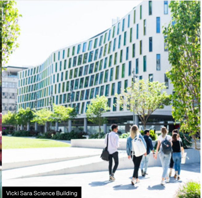
Vicki Sara Science Building